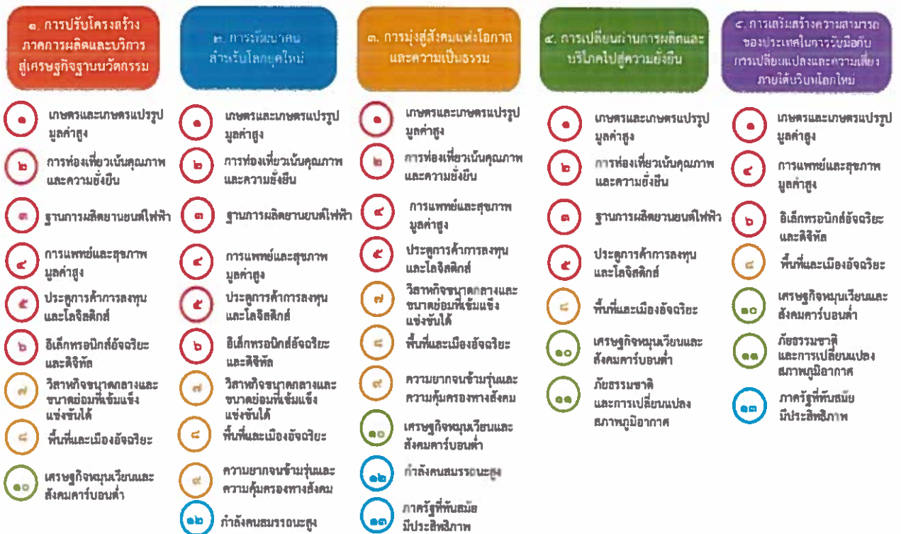
แผนภาพที่ ๓.๑ ความเชื่อมโยงระหว่างหมวดหมู่การพัฒนา กับเป้าหมายหลัก

ความเชื่อมโยงระหว่างหมวดหมู่การพัฒนา กับเป้าหมายหลักแสดงไว้ในแผนภาพที่ ๓.๑ โดยหมวดหมู่ การพัฒนาที่กำหนดขึ้นเป็นประเด็นที่มีลักษณะเชิงบูรณาการที่ครอบคลุมการพัฒนาตั้งแต่ในระดับต้นน้ำจนถึง ปลายน้ำ และสามารถนำไปสู่ผลพัฒนาทั้งในมิติเศรษฐกิจ สังคม ทรัพยากรธรรมชาติและสิ่งแวดล้อมไปพร้อม ๆ กัน ทำให้หมวดหมู่แต่ละประการสามารถสนับสนุนเป้าหมายหลักได้มากกว่าหนึ่งข้อ นอกจากนี้การพัฒนาภายใต้ แต่ละหมวดหมู่ไม่ได้แยกขาดจากกัน แต่มีการสนับสนุนหรือเอื้อประโยชน์ซึ่งกันและกัน